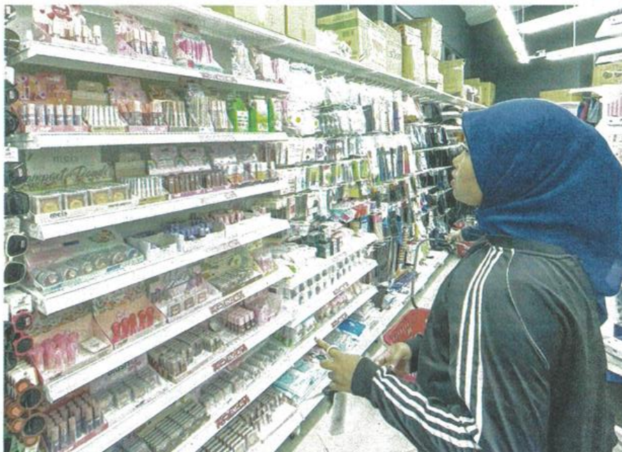
Lim urged consumers to check the NPRA notification number on product packaging as it indicates that the product has been approved by the ministry.

"Authorities should take proactive measures by investing in more resources, technology and surveillance to prevent harmful products from reaching consumers," he said.