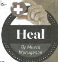
Metabolic and hormonal factors often play a significant role, making weight loss incredibly challenging.